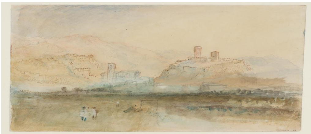
William Turner, Bellinzona from the North (1842 o 1841), © Tate Gallery , Londra

Nel contesto della prima edizione di BELLINZONA CASTLES & GO (domenica 29 maggio 2022), un banner culturale dedicato a Turner è stato posato all'altezza del KM 4.5 ca. del percorso della GARA PODISTICA 10 KM - facente parte anche del percorso della GARA WALKING/NORDIC WALKING 10 KM - in un punto la cui visuale diretta (frontale) sui castelli di Sasso Corbaro, Montebello e Castel Grande e sul centro storico di Bellinzona richiama quella immortalata nel 1842 (o 1841) dallo stesso William Turner nel suo acquerello Bellinzona from the North . Scopo: informare e sensibilizzare i partecipanti alle gare circa la presenza storica, a più riprese, di William Turner a Bellinzona e il grande interesse che uno dei più importanti e celebrati pittori di sempre portò nei confronti della stessa Bellinzona.