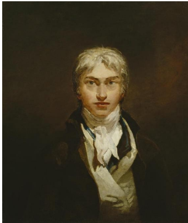
William Turner, Autoritratto (1799 ca.), © Tate Gallery , Londra

Appartenente al movimento Romantico, Turner iniziò a dipingere all'età di dieci anni. Nel 1789, entrò alla Royal Academy of Arts School. Il suo stile pose le basi per la nascita dell'Impressionismo e fu anticipatore dell'Astrattismo.